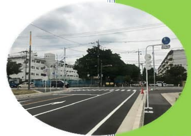
太平中学校前交差点開通